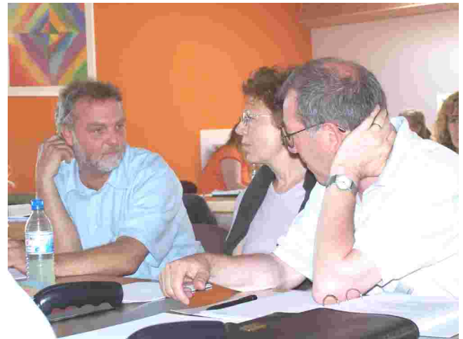
Gemeinsames Nachdenken bei der Gruppenarbeit